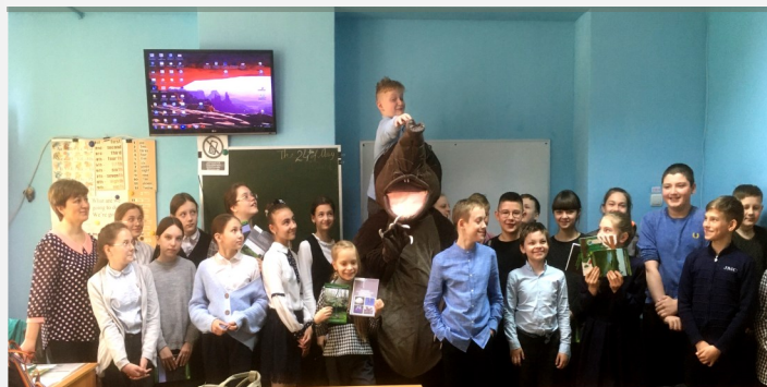
Хохуля в гостях у наших ребят. 5в класс, 2022 год.

- Самое основное и актуальное на данный момент – это загрязнение водных объектов, а дальше это, конечно, проблемы свалок в лесах. Как правило, свалки там стихийны, но их же организуем мы с вами. Отдохнули, поели, попили – вот тебе и мусор. Одни, другие, третьи – вот тебе и свалка. Как по мне, это самые яркие существующие проблемы нашей области.